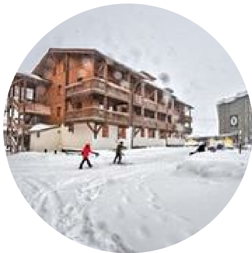
A Appartement Lombarde D "Diamond" : 284 rue de la Lombarde 73440 Val Thorens